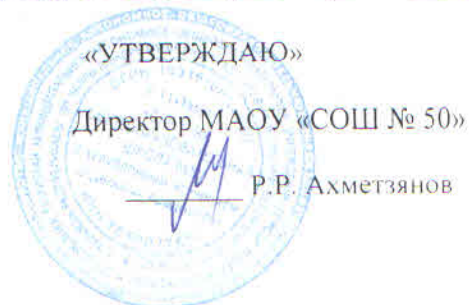
График питания в школьной столовой